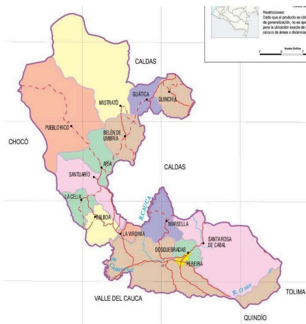
Ilustración 1: División política del departamento de Risaralda